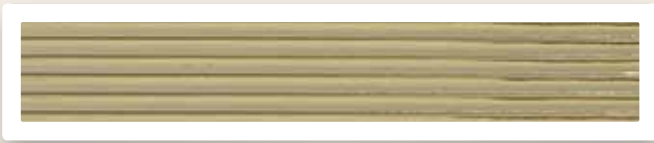
Flachstreifen 3 mm