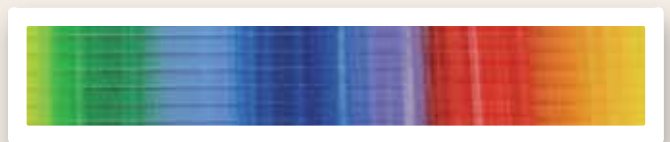
Flachstreifen 3 mm Regenbogen