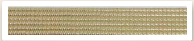
Perstreifen 3 mm