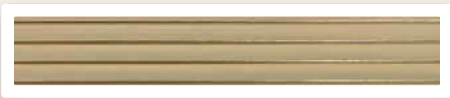
Flachstreifen 5 mm