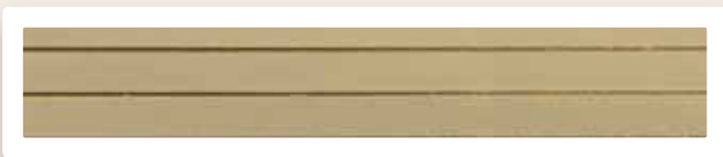
Flachstreifen 7 mm