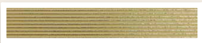
Rundstreifen 2 mm