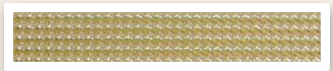
Perstreifen 4 mm