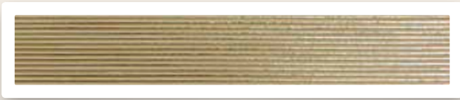
Flachstreifen 1 mm