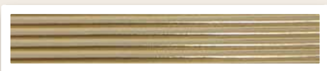
Rundstreifen 4 mm