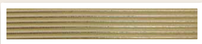
Rundstreifen 3 mm