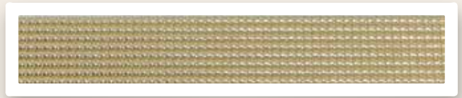
Perstreifen 2 mm