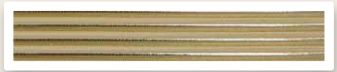
Rundstreifen 5 mm