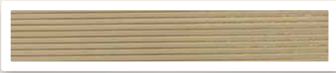
Flachstreifen 2 mm