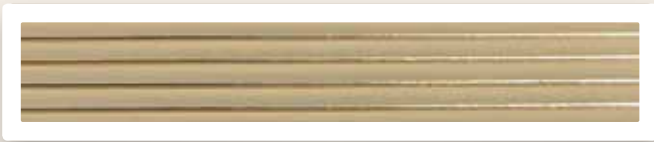
Flachstreifen 4 mm