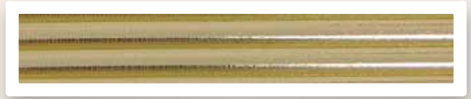
Rundstreifen 7 mm